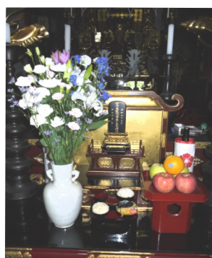
写真②リングが乗ったお三宝