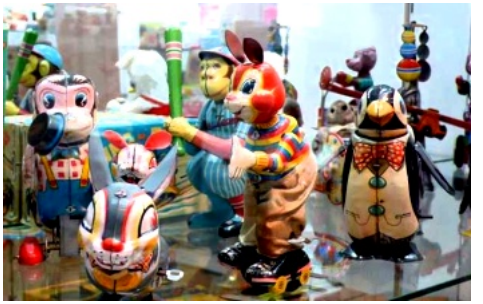
「幸せな時代の物たち」をテーマにプリキのおもちゃはもちろんだが、キャラクター人形、ミニカーなど、更に昭和のレコードや企業広告物、ファッション関連、現代作家の作品と、北原コレクションのほぼすべてのアイテムが勢揃いしています。