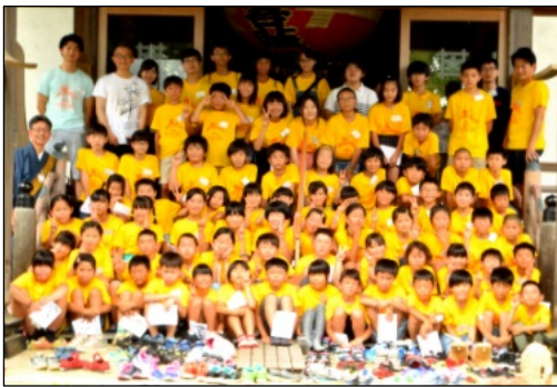
68名の参加小中学生とスタッフの皆さん

■第21回「本照寺一泊お山しゅぎょう」を8月4〜5日の土日にわたり開催しました。土曜日が「厚木鮎祭り・花