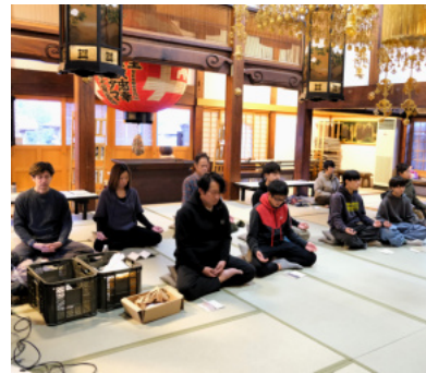
唱題行の瞑想中。終了後は仏教の話など30分以上の意見交換が盛り上がりしました。

学生が友人と参加してくれ、ヨガ19名、水行14名、唱題行10名のべ43名の参加です。体力の続く限り毎年継続して開催していきたいと思っております。皆さまも是非ご参加ください。