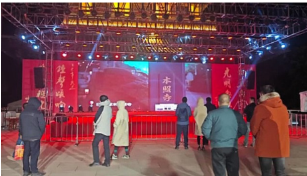
大晦日、中国、揚州市の大明寺で流された本照寺の鐘撞きの様子。30秒程度の動画を本照寺のSNSに挙げています。

■厚木市には友好都市がいくつかあり、昨年、中国揚州市と40周年を迎えました。記念として、厚木のお寺の鐘撞きの様子