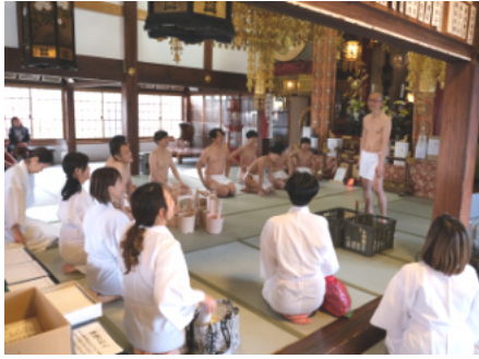
和やかに水行の説明を聞く参加者。なんと、女性の参加も6名いらっしゃいました。