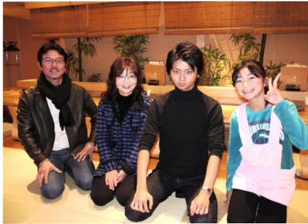
④から次女・中1、次男24