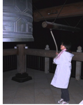
寒い中ですが、気が引き締まります！

■年が改まるっていいですね。心機一転、好きな言葉です。はじめとなります。ダラダラでなく、よし！今年も！で、張り切って参